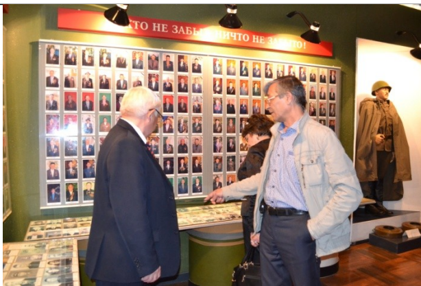
В зале Боевой Славы