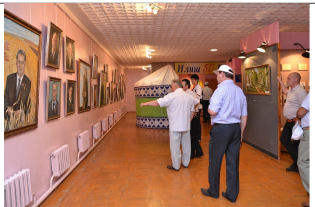
Зал Трудовой Славы