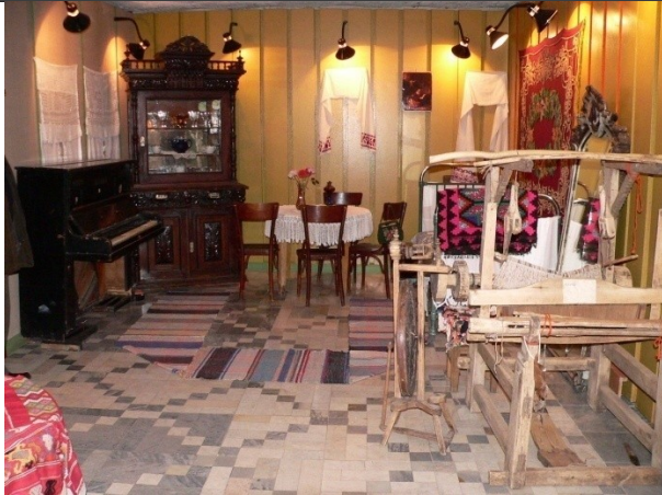
Зал русского быта