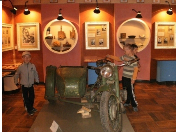
Трофейный мотоцикл БМВ